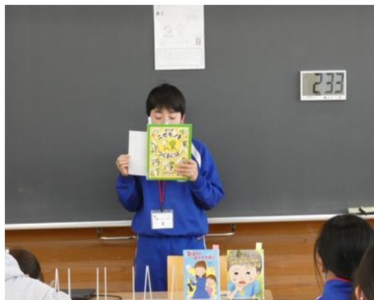
「ぼくのニセモノをつくるには」