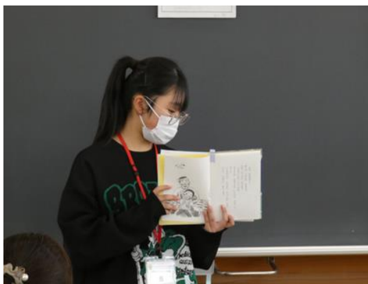
「うちゅうでいちばん」