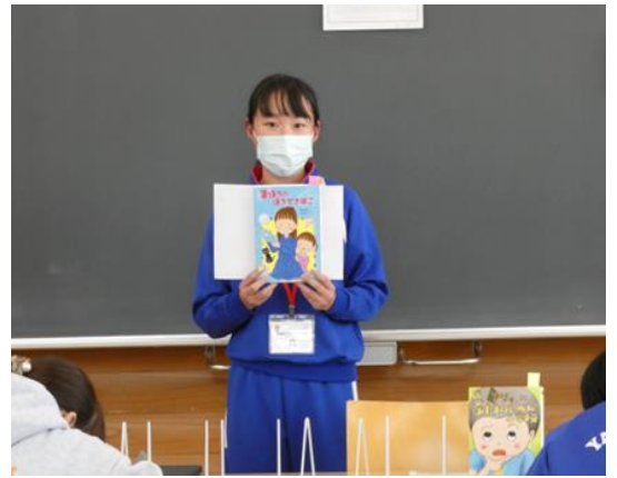
「まほうのほうせきばこ」