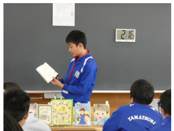
「54字の物語 参 みんなでつくる 意味がわかるとゾクゾクする超短編小説」