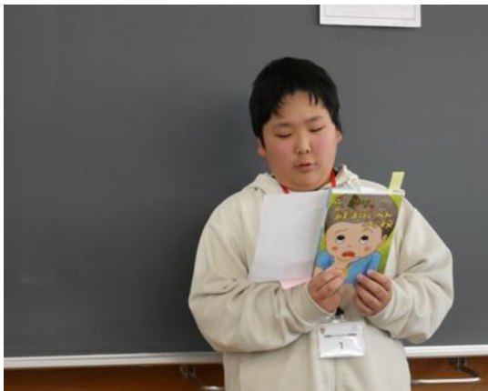
「区立あたまのてっぺん小学校」